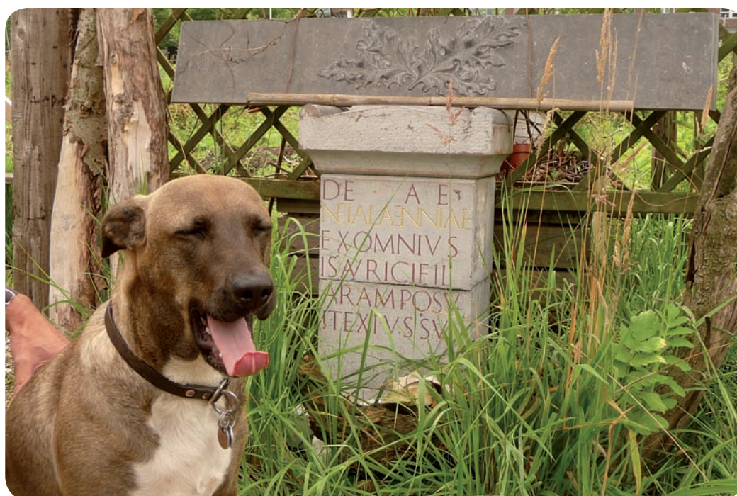
Siert poseert als een natuurtalent bij het altaar.

en is tijdens een storm in het jaar 300 na Christus weggeslagen. Rond 1647 kwamen restanten van de tempel tevoorschijn. De tempel is opgedragen aan de inlandse godin Nehalennia, zogezegd een Zeeuws meisje, aldus Koos. Een visser had in een droom de ‘opdracht’ gekregen om een altaar te maken. De letterlijke vertaling op het altaar luidt: Voor de godin Nehalaennia heeft Examinus, Isauricus zoon, dit altaar opgericht, volgens haar bevel. Koos denkt even na: “Deze tuin is niet persé om te werken, het is een plek om te schuilen.”